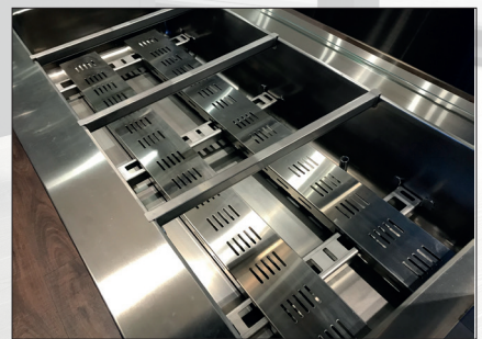
Nuovo bagnomaria secco New dry heated bain-marie