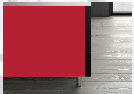
Ampia proposta di finiture e materiali Wide range of finishing and materials