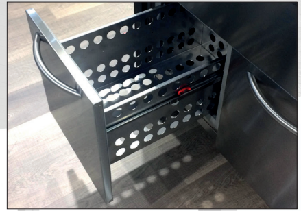
Cassetti refrigerati con guide telescopiche Refrigerated drawers with telescopic guides